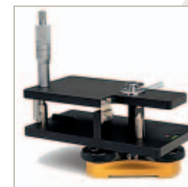
Adaptador de pendiente

Para trabajos de una pendiente está disponible un adaptador opcional que permite manualmente colocar el instrumento en la pendiente requerida